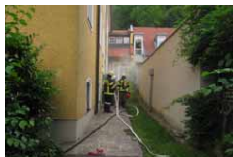
Übung bei der Polytechnischen Schule