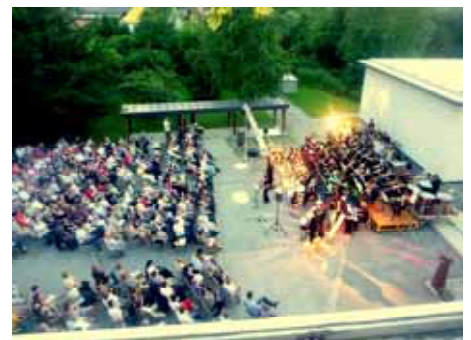
Konzert im Vorhof Schloss Neudorf