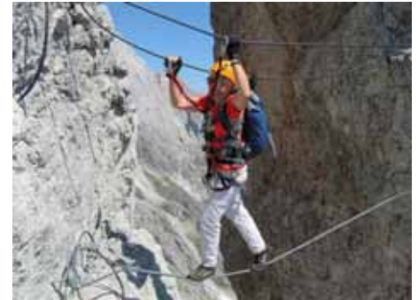
Technik und Taktik auf Klettersteigen