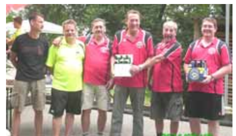
Sieger Kalsdorf Süd