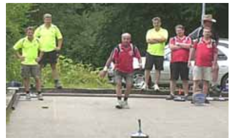
ESV Wildon : Kalsdorf Süd