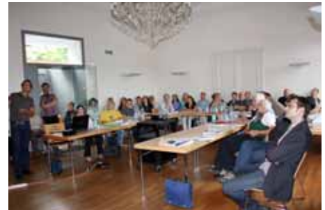
Tagung: Wissenschaftler aus mehreren Nationen nahmen am 3. Wildoner Fachgespräch teil.

Die Ausstellung „Wildoner Wirtschaft in alter Zeit“ ist noch bis 12. August während der Gemeindeöffnungszeiten im Schloss Wildon zu besichtigen! Schloss Wildon, Hauptplatz 55, 8410 Wildon, Tel. 03182/3227