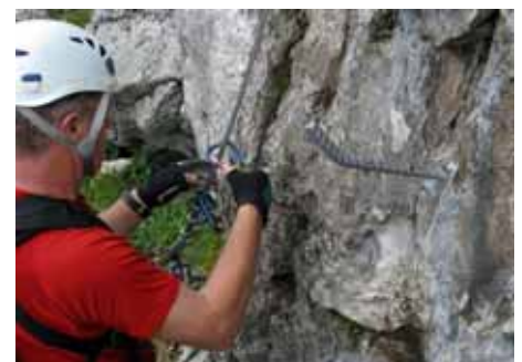
Sicherheit beim Klettern