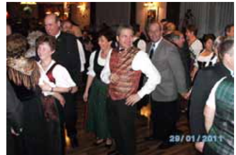
Auf der Tanzfläche herrschte Hochbetrieb.

Für manchen Besucher ging die beschwingte Ballnacht im Gasthaus Uhl in Stocking erst am frühen Morgen zu Ende.