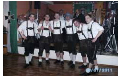
Die Schuhplattlergruppe der Landjugend Wies.