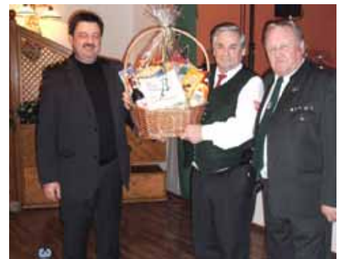
Tolle Preise warteten auf die Gewinner.