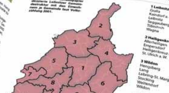
Die in einem Geheimpapier skizzierte Leibnitzer Gemeindegliederung mit den Einwohnerzahlen 2001.

Einnahmenproblem Dies zeigt sich auch in der Einnahmensituation: Kleinstgemeinden generieren pro Kopf signifikant weniger Steuermittel als größere Gemeinden. Die Gründe hierfür sind unterschiedlich: So stehen etwa in kleinen Gemeinden weniger Flächen für Betriebsanbindungen zur Verfügung, gleichzeitig sind sie meist auch nicht zentral gelegen